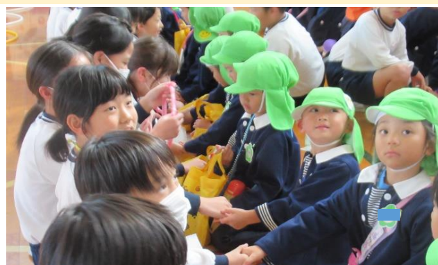
小学校4年生と年中組が交流を楽しみました。(4・4交流)

本市では、縦と横のつながりを大切にした交流活動を実施しています。園と小学校の交流と園の交流(公立・私立)など、年間を通して計画的におこなっています。それにより、1年生の入学時に顔を知っている人(友達・児童・先生)が増え、安心して学校生活を送ることになります。また、子ども同士の交流だけでなく、先生同士の研修会も実施しています。互いの授業や保育を参観し理解を深め合っています。子ども一人ひとりを大切にした保育、授業を進め、楽しい園生活や学校生活になるよう取り組んでいます。