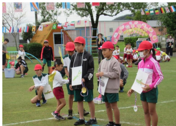
園の運動会に小学生が競技の手伝いに来てくれました。

本市では、縦と横のつながりを大切にした交流活動を実施しています。園と小学校の交流と園の交流(公立・私立)など、年間を通して計画的におこなっています。それにより、1年生の入学時に顔を知っている人(友達・児童・先生)が増え、安心して学校生活を送ることになります。また、子ども同士の交流だけでなく、先生同士の研修会も実施しています。互いの授業や保育を参観し理解を深め合っています。子ども一人ひとりを大切にした保育、授業を進め、楽しい園生活や学校生活になるよう取り組んでいます。