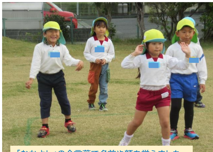
「なかよし」の合言葉で名前や顔を覚えました。