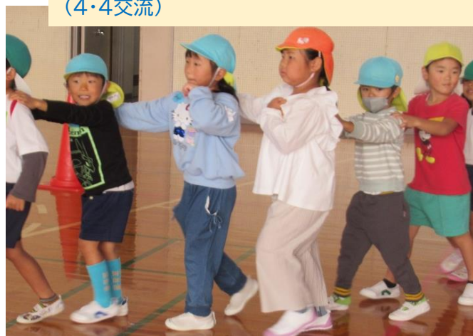
幼稚園・こども園・保育園の6園で交流して遊びました。

幼児教育センターだより『つむぐ』では、市内の幼稚園や保育所(園)こども園での実践の様子などを紹介しています。袋井市教育委員会 幼児教育センター Tel:86-3330