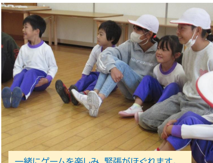
一緒にゲームを楽しみ、緊張がほぐれます。