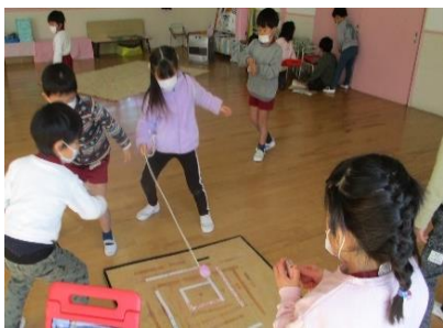
コマ回しに自信が付き、友達とより 挑戦的な遊びを考え合い楽しむ5歳児