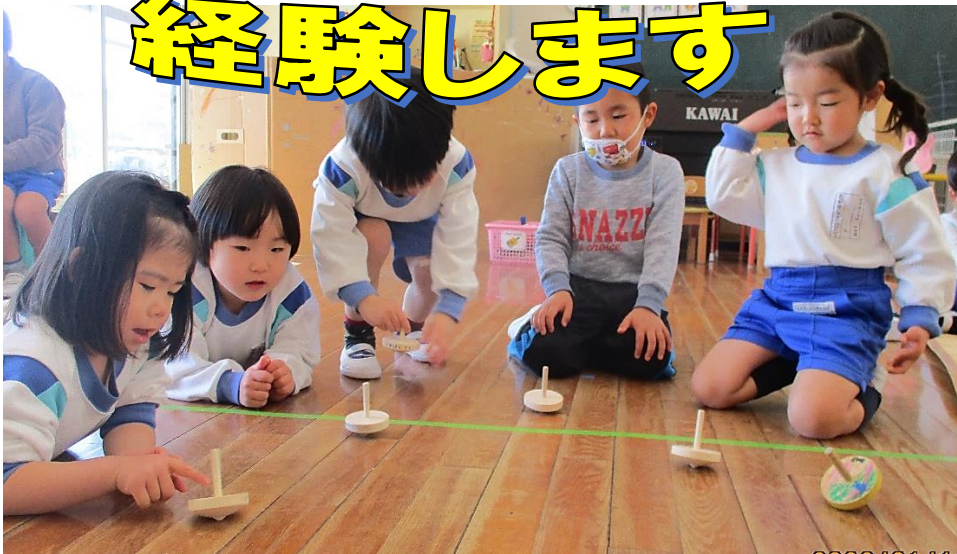
繰り返すことでコマ回しのコツをつかみ、友達との遊びを楽しむ3歳児