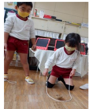
3歳で経験した手回しコマ 4歳では紐コマに挑戦

子どもが同じことを繰り返し楽しむことは、一見、無駄に思われるかもしれませんが、子どもは遊びの中でやってみて楽しいと感じ、何度も繰り返す中で気付いたり、考えたり、発見したりして、遊びに必要な動きや知識などを習得しているのです。